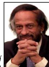
Rádžendra Pačaurí

Šéf Mezivládního klimatického panelu při OSN, Rádžendra Pačaurí, není žádným klimatologem, ani „zeleným skautem“, kterému by šlo o blaho Modré planety a odvrácení „katastrofických klimatických změn“.