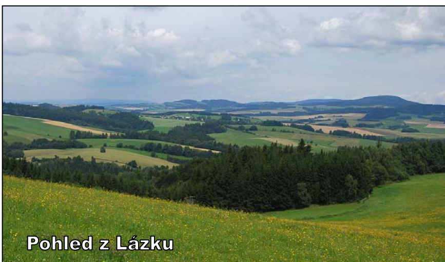
Pohled z Lázků

Když se jednou zastavíš, poznáš, že cokoliv, po čem jsi dosud toužil a co jsi ty člověče hledal, je právě tady. Být stále na cestě odněkud někam je pouhé plýtvání časem. Zastav se. Vše, po čem toužíš, je ve Tvém srdci.