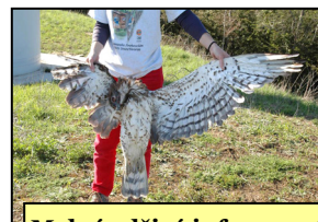
Mylné a lživé informace?

Při agitacích k souhlasu s výstavbou VE nám investoři a příznivci VE říkají, že VE jsou stavba dočasná, kterou lze po cca 20ti letech jednoduše odstranit.